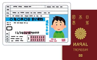
運転免許証やパスポートなど