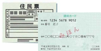
通知カードや住民票など