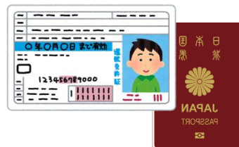
運転免許証やパスポートなど