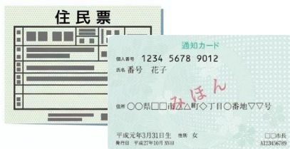
通知カードや住民票など