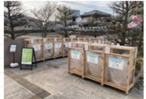
③資源回収ステーションモデル事業