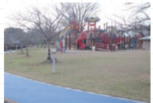
⑥大刀洗公園遊具・ウォーキングコース等改修