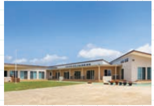
②新設保育園整備事業補助