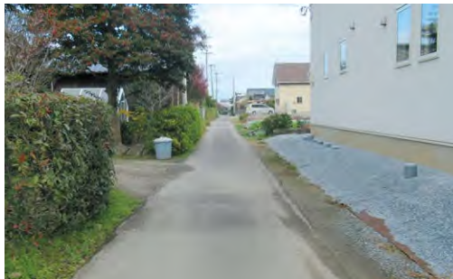
火事だ！消防車通れませんか?!とならないように

せめて協会けんぽなみの負 担に下げられるよう国に適 正な負担を求め、町独自の 財政支援を。