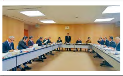
都城市議会(左)、東串良町議会で先進事例を調査