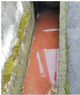
8月の赤茶けた色(左)と12月の黒い排水

規格を0.03ミリから0.04ミリに変更した。その結果、破れやすいという苦情も激減しており、一定の効果があったと考えている。 議員 現在出回っているごみ袋は、確かに以前よりも破れにくくなったが、強度だけではなく大き