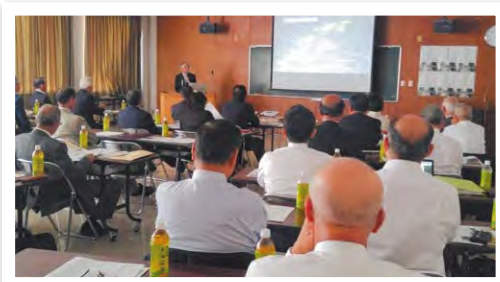
三町議会合同研修では、大刀洗町議会の改革経過と広報活性化の取り組みを発表しました。

常任委員長・副委員長などの研修会(10月26日)、大木町、広川町との三町議会合同研修会(11月7日)、福岡県町村議員研修会(1月17日)など、議員活動の質を高めるため研修を積極的に受講しています。