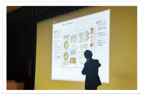
4月号の紙面を添削してもらいました

たちあらい議会だよりは、レイアウトや企画は一定の評価を受けるいっぽう、住民・団体からの意見に対して議会からの回答を行うことや、予算審議への切り口を明確にすること、ホームページへのリンクの充実などの課題を指摘されました。