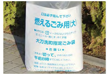
リニューアルされたごみ袋

と判明した。8月に事業所が処理装置の能力向上工事を実施し、工事後は水質・悪臭とも当初に比べると改善し、苦情も少なくなった。今後も県と協力して指導したい。