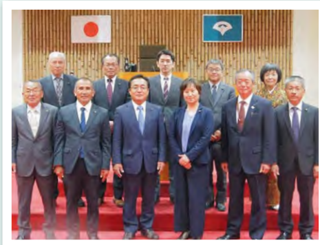
曾於市議会のみなさんと