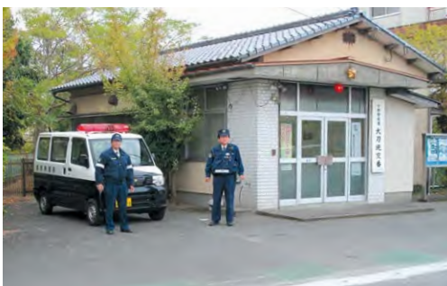
現在の大刀洗交番（本郷）