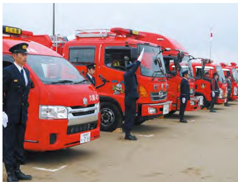
近年は災害対応も増加

31年度はこれまでと同額。32年度以降は、火災・救急の発生件数や人口割、面積割などで新たな負担割合を決める。