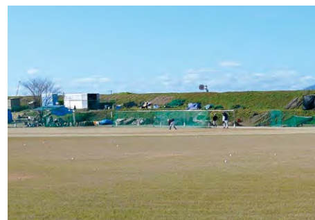
河川敷内のトイレ・倉庫

共の福祉に資するため「大刀洗町民グラウンド設置条例」などを設け、片ノ瀬橋下流岸を町民の利用に供してきた。 平成24年度の九州北部豪雨以降は、町民グラウンドとしての機能が失われたため閉鎖している。