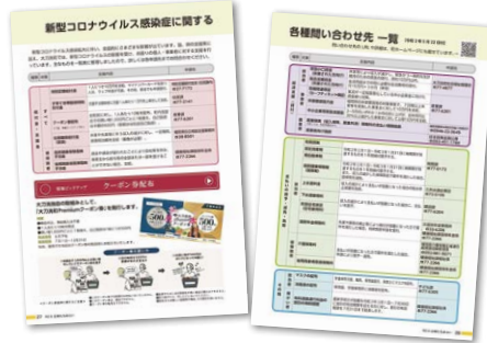
町による支援制度のお知らせ