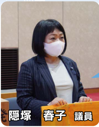
隠塚 春子 議員