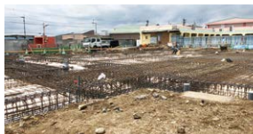
新園舎建設中の大堰保育園

令和2年度は、今後の指針となる第2期地域福祉計画の策定が予定されているほか、コロナ対策として、3月から特別貸付事業（緊急小口、総合支援）を行っています。