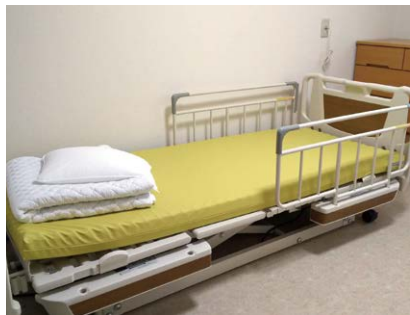
福祉避難所の一室

災害は発生するものと考えての対策計画が重要。今年はコロナ対策も加わった。3密を避けるために、毎年避難している地域を中心に問診表を事前に配布し、避難時に持参してもらっては。