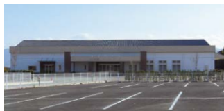
既存の建物を改修し斎場に