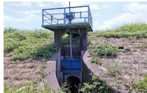
内水を佐田川へ放流する水門(床島)