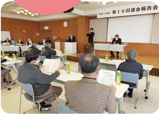
今回は対面方式で実施しました