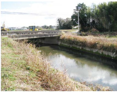
水が溢れ通行止めになる野間橋

町長 町道に架かる106橋は町が管理しており、道路橋定期点検要領に基づき、5年ごとに点検している。国・県道の橋は県が管理している。改修工事は橋の管理者が