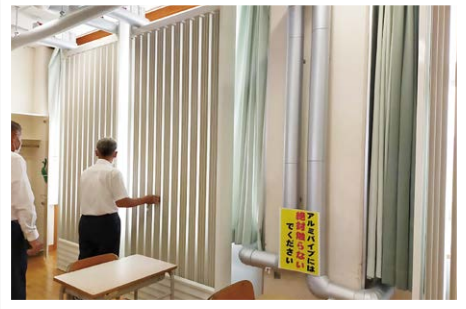
新規に設置された空調も調査

現地調査と意見交換を踏まえ、11月12日に子ども課と協議をし改善点などを要望しました。未訪問の大堰、本郷、菊池小学校の3校も来年の早い時期に訪問し、コロナ対策や空調などの学校環境を調査したいと考えています。