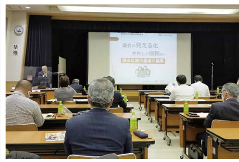
編集の基本も学びました