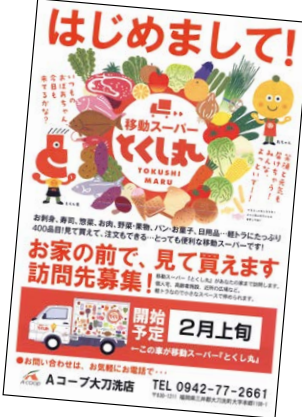
週5回以上の販売を予定している