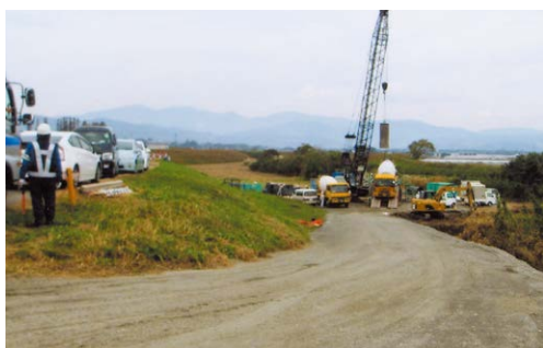
架け替えのための工事用道路

議員 本年10月から11月の2か月間実施した町内巡回バス社会実験の成果と課題は。