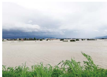
広い範囲で冠水した大堰校区(7月)

員を配置し、感染対策やスペースの確保に取り組んだ。コロナ禍で福祉避難所の対応が難しい。広域の避難は協議を進めたい。