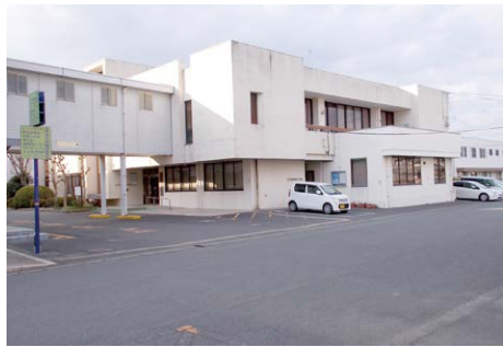
2年後に改修予定の中央公民館

町長 町が維持管理して いる公共施設などの 全体の状況を把握すると もに、将来の人口推計など にもとづき、長期的な視点 を持って、今後どのように 維持管理していくのか、そ