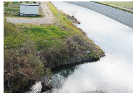
江戸橋の下流が急に狭くなる