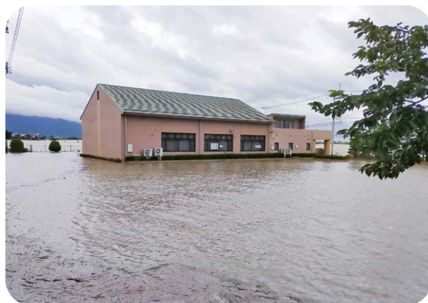
床上浸水した大堰交流センター