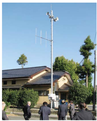
筑前町の屋外スピーカー

国の緊急防災事業債を適用、屋外拡声型で親機2基、固定支局60か所設置しています。また、平成30年には電話による自動応答システムを導入しています。