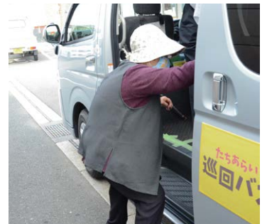
買い物が楽しみになりました

町長 利用料金は条例 の範囲内で、指定管 理者が定めることになっ ている。 令和元年度の葬祭利用件 数は66件であるが、利用料 金としての収入はない。事 業開始以来、指定管理者以 外の利用実績はない。