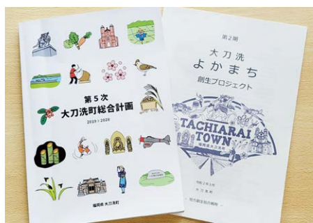
総合計画にもとづき課題の精査を

避難所について、3密の回避や居住性の改善、高齢者対策、朝倉市との避難の連携などは。段ボールベッドや仕切りなどの資材は、国のコロナ対策交付金を活用して充実を。