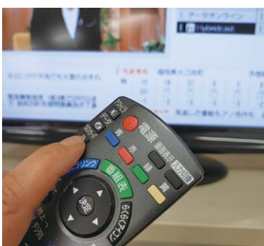
データ放送で情報を発信予定

老人クラブの会合などで具体的に説明したい。町のパソコンから随時更新が可能なので、災害時には災害対策会議の決定事項をリアルタイムで配信する予定。