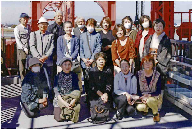
▲視察研修集合写真(11月5日)

た作品に触れると本当に恵まれたような、救われたような気になる：（注略） 古賀メロディーを生んだ文化の薫りあふれる街の歴史に触れた視察でした。