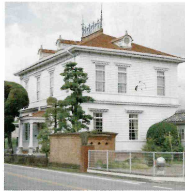
▲大川市立清力美術館

※文化協会では、部や社中の展覧会や発表会を推奨しています。また、公募展への応募も奨励しています。