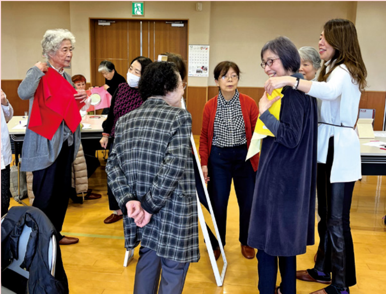
カラーコーディネート講座