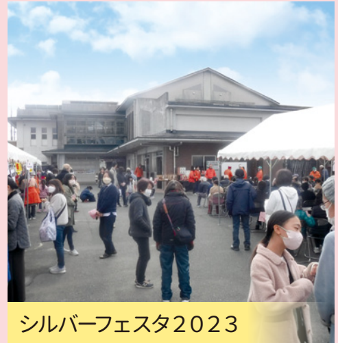
シルバーフェスタ2023