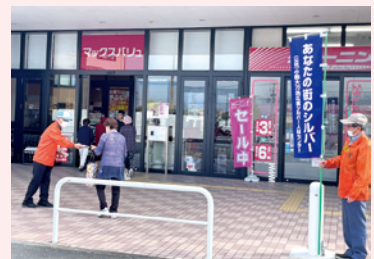
マックスバリュ小郡七塔通り店