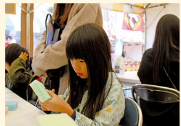
“ふわふわボール”工作中