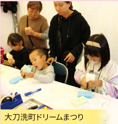
大刀洗町ドリームまつり