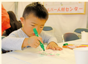
“紙コップおぼけ”工作中

大刀洗町ドリームまつりで、小学生以下の子供を対象とした工作教室(ビーズストラップ・紙コップおぼけ・ふわふわボールの作成)を開催しました。