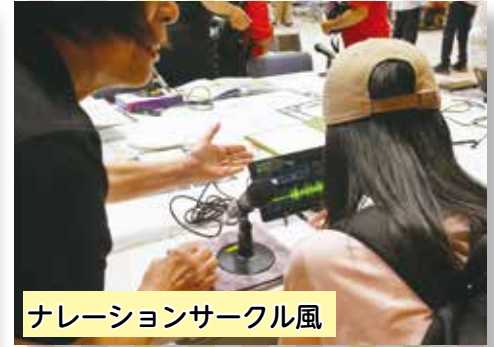
ナレーションサークル風