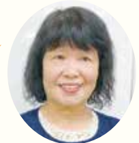
おおぞら保育園 原園長

職員でもない、保護者でもない、お兄ちゃんやお姉ちゃんが来てくれたことがうれしかったと思います。中には、手をつないで離さない子もいました（笑） 子どもたちは、いろいろな人との関わりが大事だと思います。園としても、心を育てる保育をしたいと思っています。貴重な機会を本当にありがとうございました。