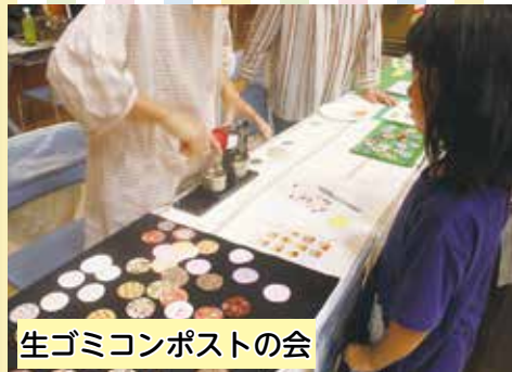
生ゴミコンポストの会