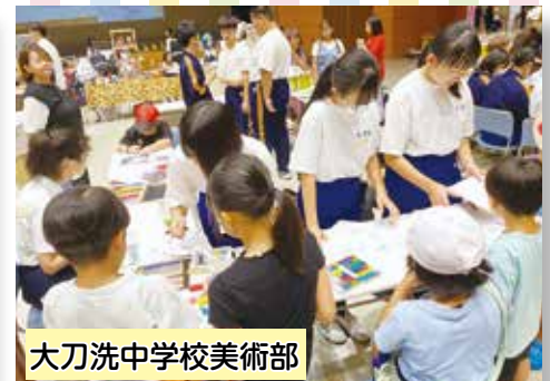
大刀洗中学校美術部