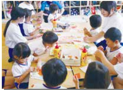
年中：ちぎり絵でライオンとウサギを作りました。