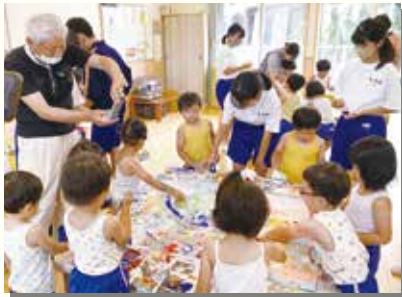
年少：野菜ハンコやスタンプで虹や花火の大きな絵を描きました。

令和6年7月23日、大刀洗中学校美術部とおおぞら保育園の園児が作品作りを通して交流しました。 中学生が主体となって、年齢に応じた企画・準備を行いました。