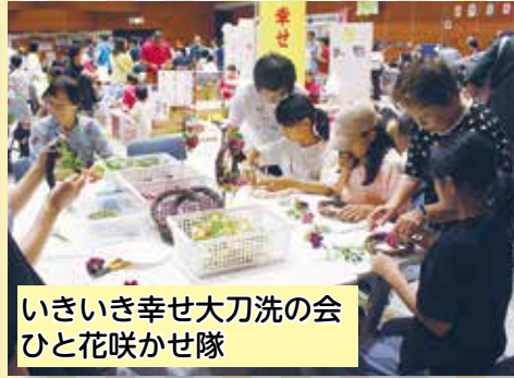
いきいき幸せ大刀洗の会 ひと花咲かせ隊