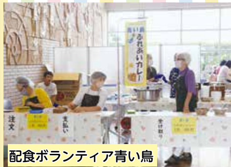
配食ボランティア青い鳥