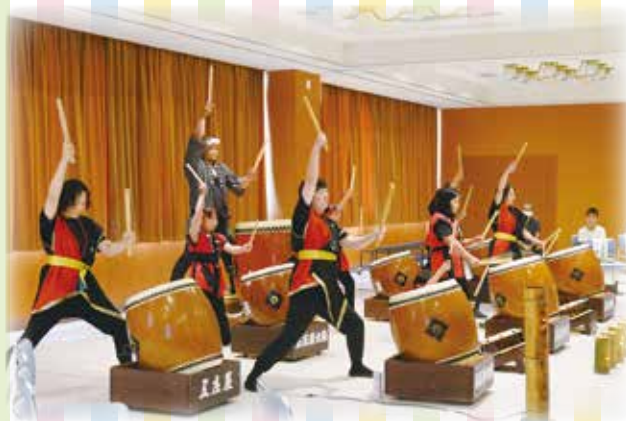
五庄屋太鼓の力強い演奏