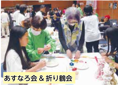
あすなる会 & 折り鶴会