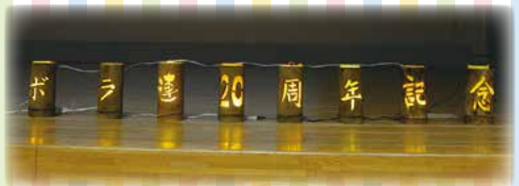
灯わ会の皆さんが製作してくれた記念の竹灯ろう