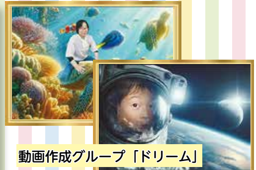
動画作成グループ「ドリーム」