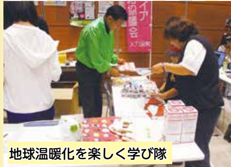
地球温暖化を楽しく学び隊