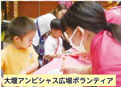
大堰アンビシャス広場ボランティア