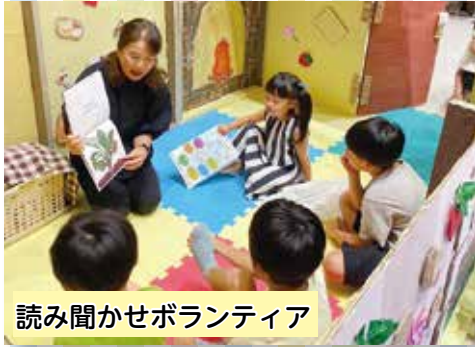
読み聞かせボランティア