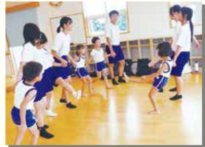
年長：似顔絵を描いた後「♪花いちもんめ」で遊びました。