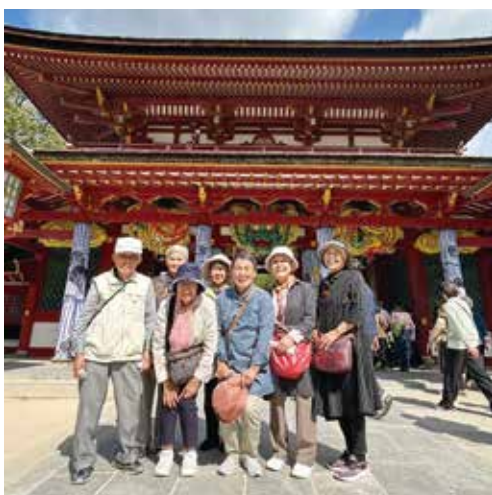
太宰府へお出かけ